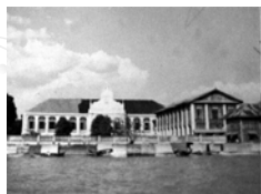
โรงเรียนสุนันทาลัย (สตรี)