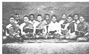
โรงเรียนสอนภาษาอังกฤษในวัง