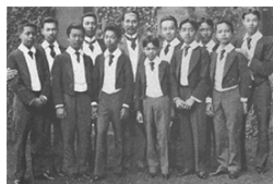
เจ้านายที่ไปศึกษาภาษาอังกฤษที่สิงคโปร์