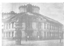
โรงเรียนวัดมเหยงคณ์พาราม