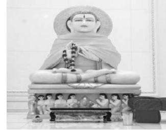
พระพุทธเจ้าที่วัดวิษณุ เขตยานนาวา กทม. ตามคัมภีร์ของชาวฮินดูถือว่าเป็นอีกปางอวตาร ของพระวิษณุ หรือ พระนารายณ์