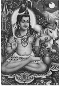
ผู้ทำลาย (Destroyer) และผู้สร้างใหม่ (Re - creator)