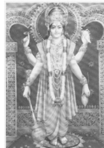
ผู้รักษา (Preserver)