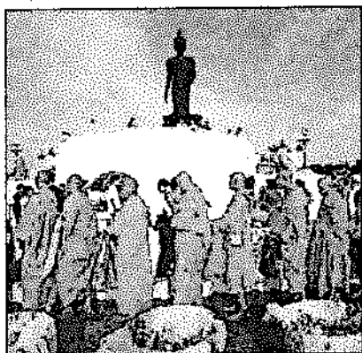
- ทำบุญตักบาตร บริเวณพุทธมณฑล

• จัดงานส่งเสริมพระพุทธศาสนาที่บริเวณท้องสนามหลวงเป็นประจำทุกปี แต่ละปีมีกิจกรรมทางพระพุทธศาสนาหลากหลายหน่วยงาน ทั้งทางราชการ และเอกชนทั้งฝ่ายบรรพชิต และคฤหัสถ์ ร่วมกันจัดงานอันยิ่งใหญ่สร้างความศรัทธาให้แก่พุทธศาสนิกชนบำเพ็ญกุศล มีการทำบุญตักบาตร ให้ทานรักษาศีลฟังธรรม สนทนาธรรม เวียนเทียน เจริญภาวนาเป็นที่ประทับใจยิ่งนัก