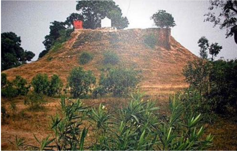
เทวโรหนสถูป เมืองสังกัสสะ แคว้นปัญจาละ สถานที่สร้างขึ้นเพื่อรำลึกถึงสถานที่พระพุทธเจ้าเสด็จลงจากสวรรค์ชั้นดาวดึงส์ ปัจจุบันมีเทวาลัยของฮินดูตั้งอยู่ด้านบนสถูป