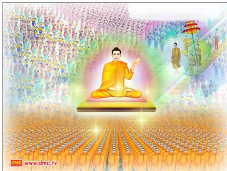
มหาชนเฝ้ารอคอยการเสด็จกลับมาของพระพุทธองค์จึงได้เกิดประเพณีตักบาตรเทโวโรหณะขึ้นมา